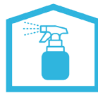
消毒用アルコールの設置 室内の除菌を徹底