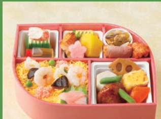
※写真はイメージです サイズ 約15.5×約20×高さ約5.5cm

【御献立】 赤魚西京焼 九十蜜煮 厚焼玉子 蒟蒻田舎煮 合鴨燻製 蛸入りさつま赤唐辛子揚げ 落・木耳・つき蒟蒻・油揚げ煮 野菜包み寄せ 鶏つくね焼 六方里芋 蓮根田舎煮 人参 白胡麻クリーム豆腐 蟹風味蒲鉾 旨出汁 ちらし寿司 海老 錦糸玉子 椎茸旨煮 酢蓮根 赤でんぶ ほか