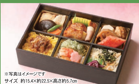
※写真はイメージです サイズ 約15.4×約22.5×高さ約5.7cm