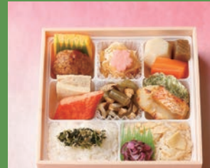
※写真はイメージです サイズ 約17×約17×高さ約5.5cm

【御献立】 赤魚西京焼 えんどう豆さつまあおさ揚げ 鶏高野豆腐含ませ煮 蟹風味しんじょ揚げ煮 鶏つくね焼 厚焼玉子 蒸し鶏中華くらげ和え 落・木耳・つき蒟蒻・油揚げ煮 六方里芋 蒟蒻田舎煮 人参 白御飯 野沢菜ちりめん 筍御飯 ほか