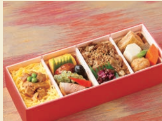
※写真はイメージです サイズ 約9.5×約25×高さ約5.2cm

【御献立】 牛肉香味焼 白御飯 豚角煮 白御飯 錦糸玉子 合鴨燻製 えんどう豆さつまあおさ揚げ 厚焼玉子 鶏つくね焼 黒花豆 鶏ごぼうつみれ 肉詰め油揚げ煮 六方里芋 角蒟蒻 人参 ほか