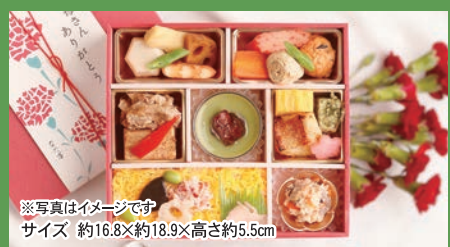
※写真はイメージです サイズ 約16.8×約18.9×高さ約5.5cm