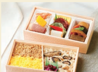
※写真はイメージです サイズ 約9.5×約17.9×高さ約8.8cm

【御献立】 《上段》 鶏つくね焼 えんどう豆さつまあおさ揚げ 焼板蒲鉾 厚焼玉子 合鴨燻製 ポテトサラゲ 蟹風味蒲鉾 角南瓜 野菜の旨煮 里芋 椎茸 蓮根 人参 蒟蒻 《下段》 白御飯 鶏ごぼろ 錦糸玉子 きのこ入り五目御飯 ほか