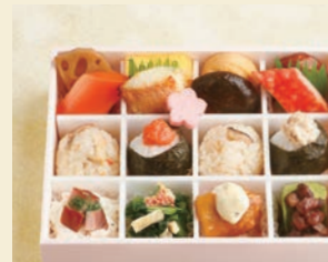
※写真はイメージです サイズ 約15.5×約20×高さ約5.5cm

【御献立】 《上》 赤魚祐庵焼 蟹風味しんじょ揚げ煮 鶏つくね焼 厚焼玉子 がんも煮 蓮根田舎煮 椎茸旨煮 人参 蒟蒻田舎煮 《中》 手毬御飯 五目御飯 白御飯 ツナサラゲ 明太子 焼海苔 《下》 鶏南蛮漬 タルタルソース ポテトサラゲ 合鴨燻製 あおさ 小松菜浸し 梅胡麻 甘味 わらび餅(抹茶) 小豆 ほか