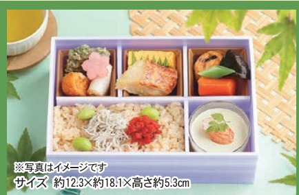
※写真はイメージです サイズ 約12.3×約18.1×高さ約5.3cm