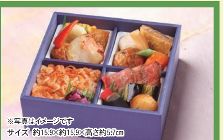
※写真はイメージです サイズ 約15.9×約15.9×高さ約5.7cm