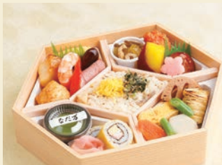
※写真はイメージです サイズ 約18.8×約24.8×高さ約6cm

【御献立】 鱈西京焼 合鴨燻製 蟹風味つま蒸し揚げ 海老芝煮 厚焼玉子 黒花豆 鶏つくね焼 九十蜜煮 蓮根挟み赤唐辛子揚げ 落・木耳・つき蒟蒻・油揚げ煮 野菜包み寄せ 巻湯葉 六方里芋 蓮根田舎煮 人参 蒟蒻田舎煮 細巻(錦糸玉子) 厚焼玉子 蟹風味蒲鉾 マヨネーズ 五目御飯 野沢菜ちりめん 錦糸玉子 甘味 抹茶プリン 小豆 ほか