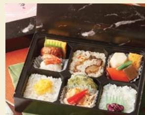
※写真はイメージです サイズ 約17×約22×高さ約4cm

【御献立】 厚焼玉子 鶏つくね焼 ポテトサラゲ 蟹風味蒲鉾 きのこ入り五目御飯 六方里芋 野菜包み寄せ 蒟蒻田舎煮 人参 白胡麻入り寿司飯 錦糸玉子 えんどう豆さつまあおさ揚げ 豚肉しぐれ煮 生姜餡 玉葱 白御飯 ほか