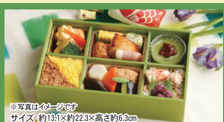
※写真はイメージです サイズ 約13.1×約22.3×高さ約6.3cm