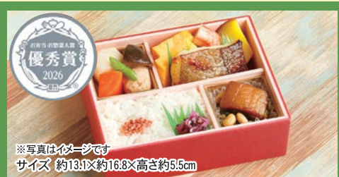
※写真はイメージです サイズ 約13.1×約16.8×高さ約5.5cm