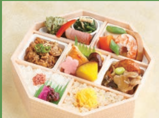
※写真はイメージです サイズ 約19.2×約19.2×高さ約5.4cm

【御献立】 鱈西京焼 厚焼玉子 九十蜜煮 黒花豆 合鴨燻製 蛸入りさつまあおさ揚げ 小松菜煮浸し 白子入り蟹つまみれ 海老芝煮 六方里芋 蓮根田舎煮 人参 鶏つくね焼 ヒリ辛甘酢餡 茄子 舞茸 枝豆 牛肉香味焼 玉葱 青唐 五目御飯 錦糸玉子 白御飯 梅胡麻 ほか