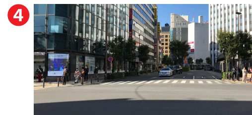
いちよし証券さんが目印の交差点を渡る