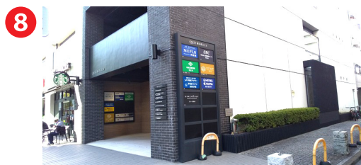
スターバックスコーヒーさんの 右隣がビル入口となります