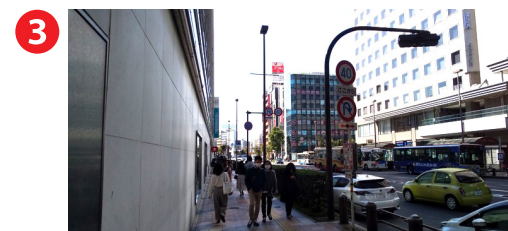
横浜高島屋さんの脇を通過