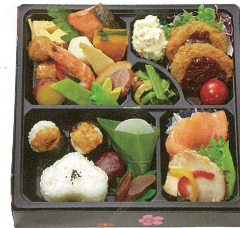
名古屋名物 天むす・みそかつ入り 尾張御膳 1,500円(税別) 24.4×24.4cm