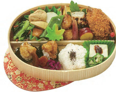
名古屋名物 天むす入り 小町 1,200円(税別) 22×15cm