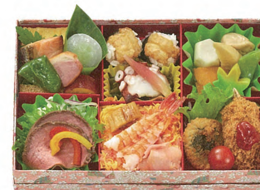
味扇 2,000円(税別) 24.4×16cm