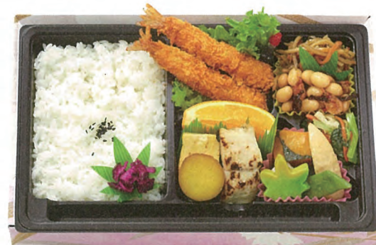
味話 800円(税別) 27.6×18.3cm