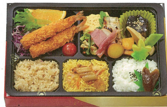
味三昧 1,000円(税別) 27.6×18.3cm