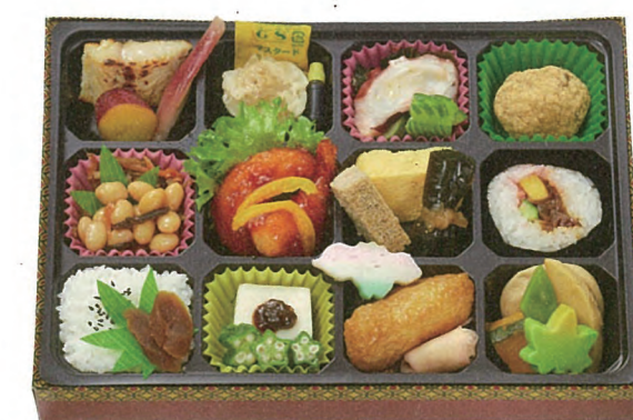
十二単 1,300円(税別) 28.4×20.1cm