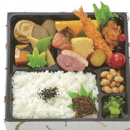
彩 800円(税別) 20.5×20.5cm