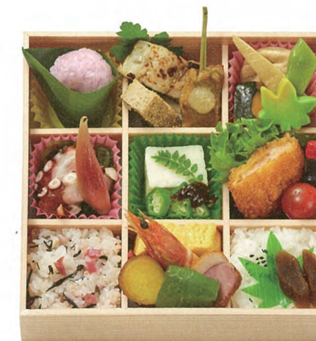
花暦 1,500円(税別) 19.5×19.5cm