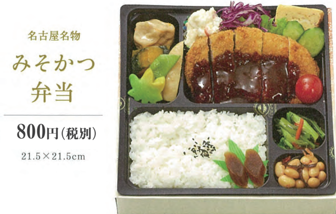
名古屋名物 みそかつ 弁当 800円(税別) 21.5×21.5cm