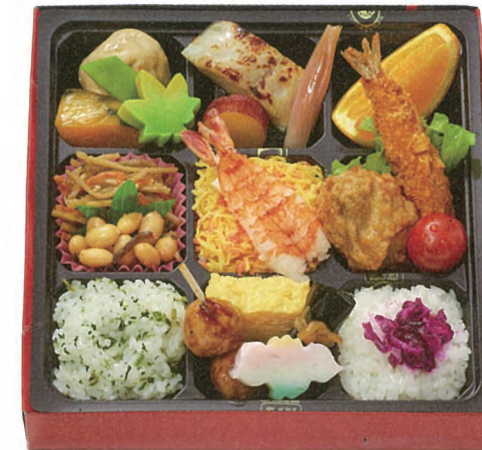
山波 900円(税別) 21.4×21.4cm