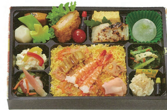
ちらし寿司 弁当 1,000円(税別) 27.6×18.3cm