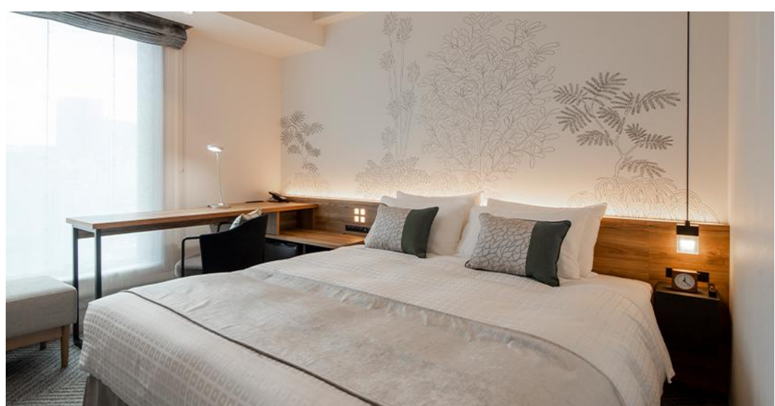
客室：コンフォートダブル