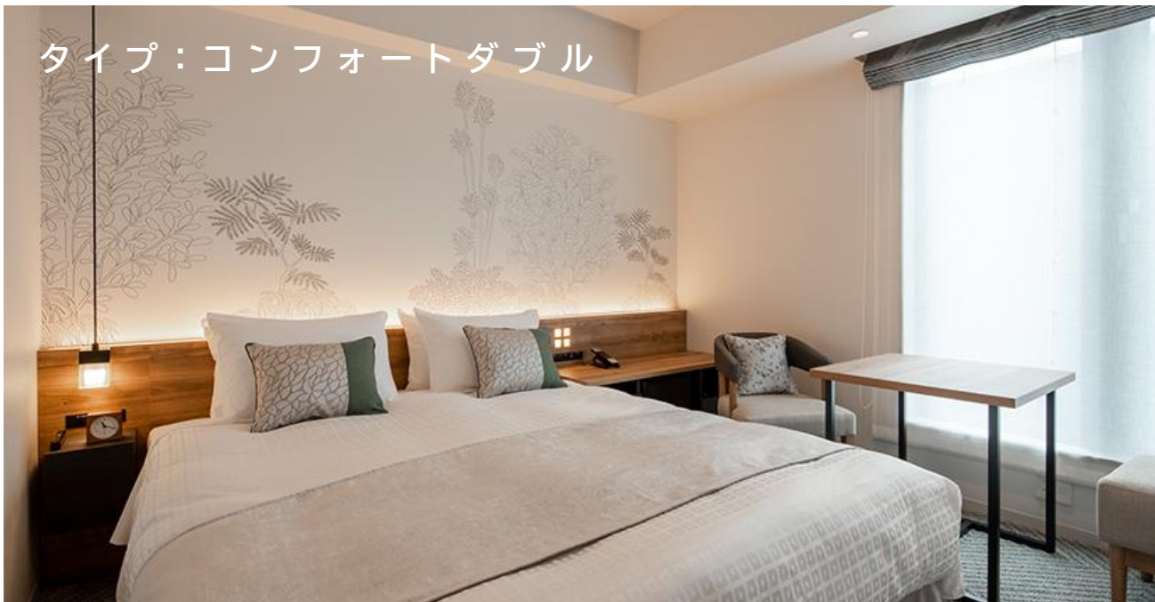
タイプ:コンフォートダブル