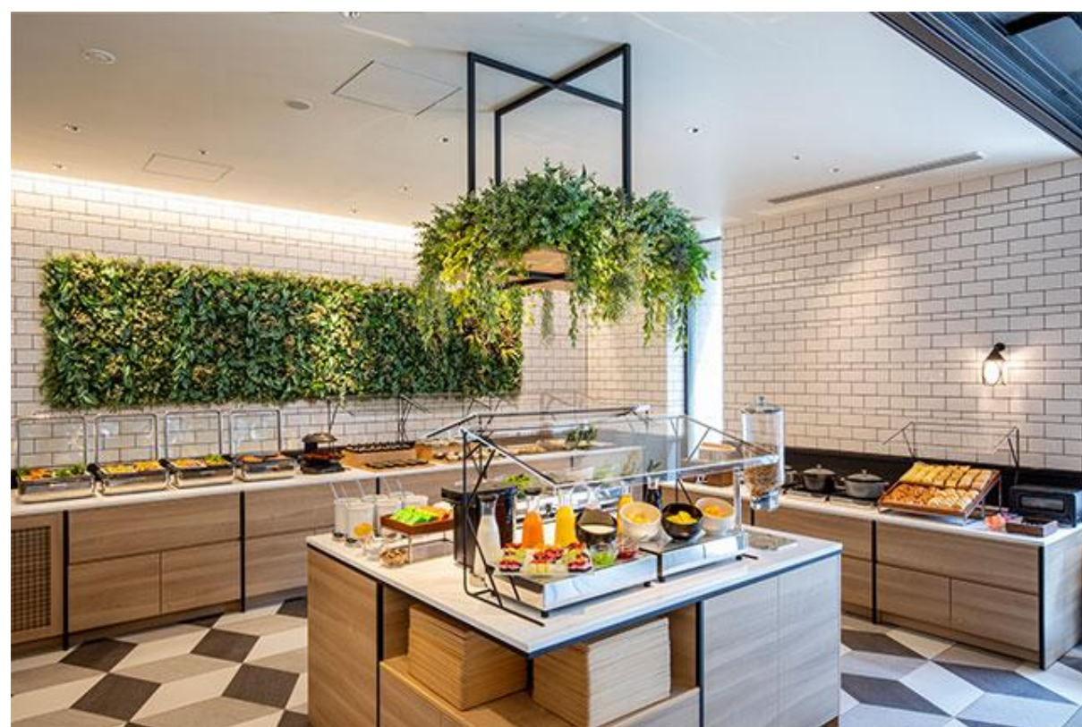
朝食：ビュッフェイメージ