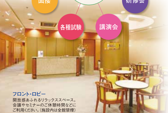
フロント・ロビー 開放感あふれるリラックススペース。 会議やセミナーのご休憩時間などにご利用ください。(施設内は全館禁煙)