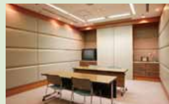
P.プレゼンテーションルーム(面接)